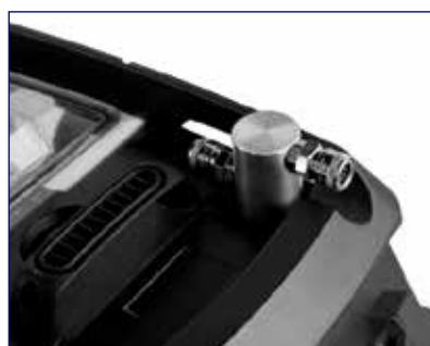
Υποδοχή για σύνδεση με εργαλεία αέρος