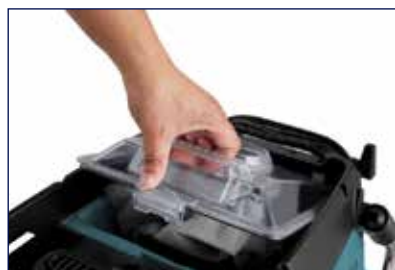
Σακούλα πολλαπλών χρήσεων