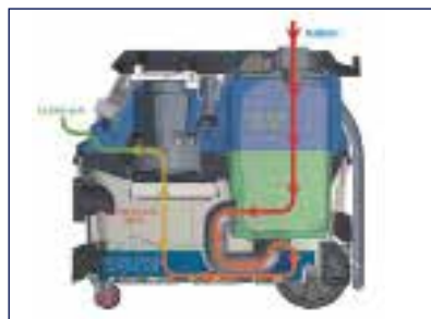
Σύστημα τριπλού φιλτραρίσματος